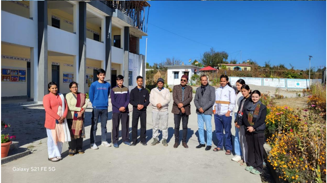
Galaxy S21 FE 5G